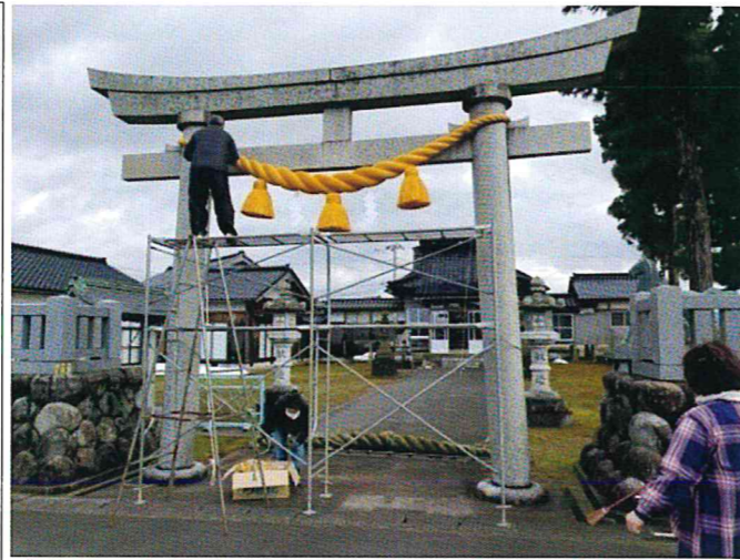
3月20日 本江神社にて注連縄を新調しました