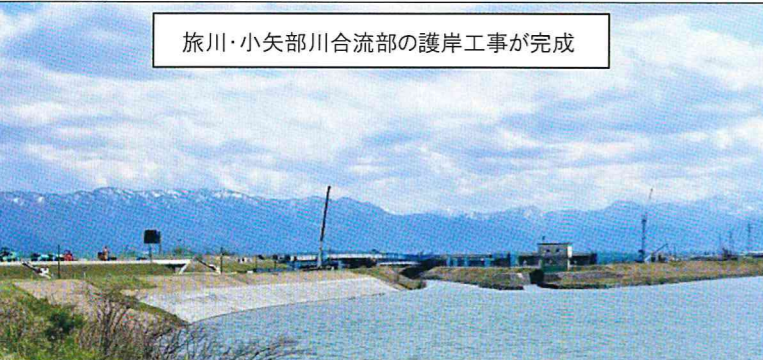
旅川・小矢部川合流部の護岸工事が完成