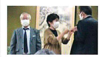
協議会会長交代バッジ引継式