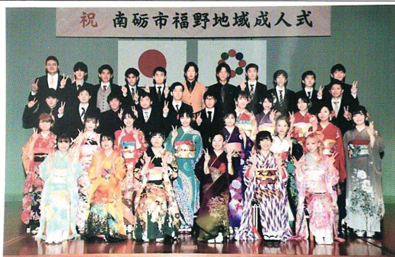
祝 南砺市福野地域成人式

令和3年度《定期総会》は新型コロナ対応のため「書面表決（承認）」による代替総会とし、4月22日（木）午後7時より北部交流センターにて《拡大常任委員会》で質疑の上、承認されました。