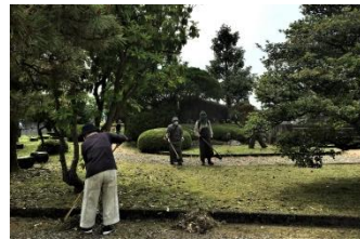
5月25日 近思公園草刈り

*その他、民生委員・福祉推進員などが家庭を訪問した際に代筆やコピーのお手伝いをします。安心して頼んで下さい。