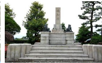
6月12日頌和塔(洗浄後)