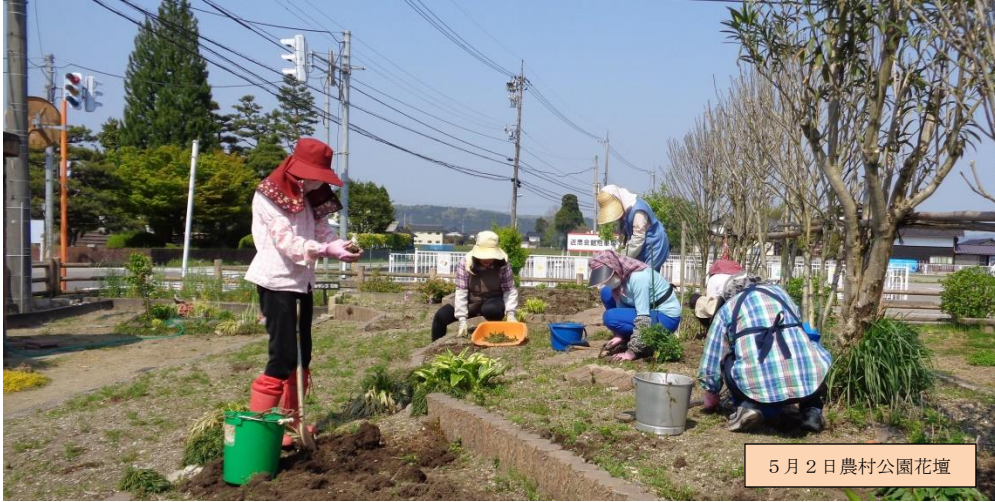
5月2日農村公園花壇

TEL/FAX:0763-22-6350 Mail: hokubu.kmn@gmail.com