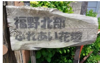
5月30日 北部花緑愛好会